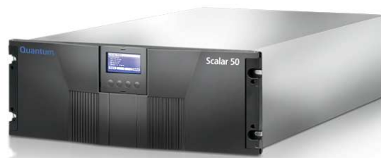
Biblioteka taśmowa Scalar 50

StorageCare Guardian - bezpłatne narzędzie służące do zdalnego monitoringu i diagnostyki urządzenia przez inżynierów Quantum